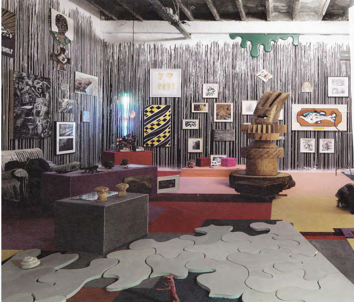
Vue de l'exposition collective «I am by Birth a Genevèse» Espace Forde, Genève, 2009