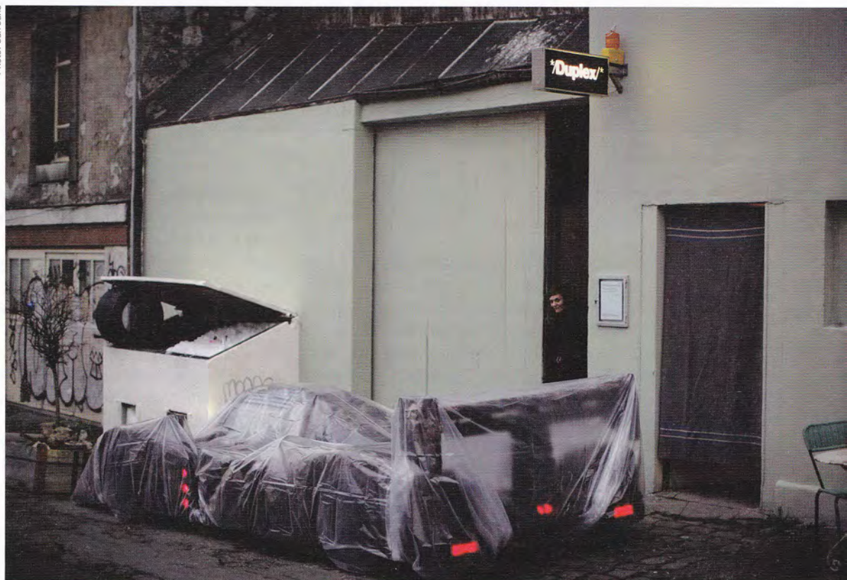
Devant l'entrée de Duplex: Hivernation d'Azrof XII de Andreas G. Kressig Sculpture de voiture recouverte de cheveux humains