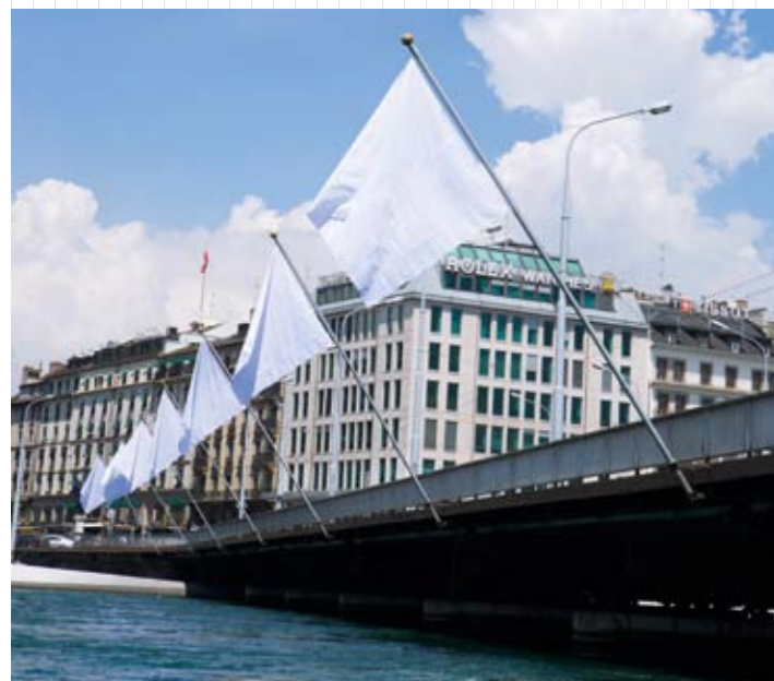
Drapeau de Gianni Motti, Hedge Flag | Lauréat du Prix du Quartier des Bains 2009.

« En ce moment de déstabilisation économique, je propose des drapeaux complètement blancs. Pas de signe, de logo, d'information ou d'image mais une trêve pour le spectateur... Le drapeau blanc symbolise la trêve et la reddition. Ces derniers temps, le système capitaliste en crise vient, pour la première fois, de sortir le drapeau blanc. Ce serait intéressant de voir cette trêve ou reddition flotter au vent sur le Pont du Mont-Blanc, juste en face de banques... » (Extrait de la note d'intention de l'artiste, Gianni Motti).