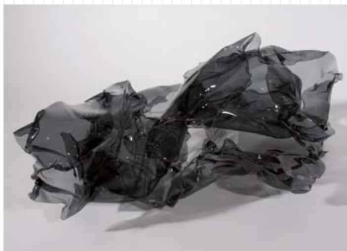
Pierre Vadi, Will-o'-the-wisp , 2008, cellulose acetate butyrate