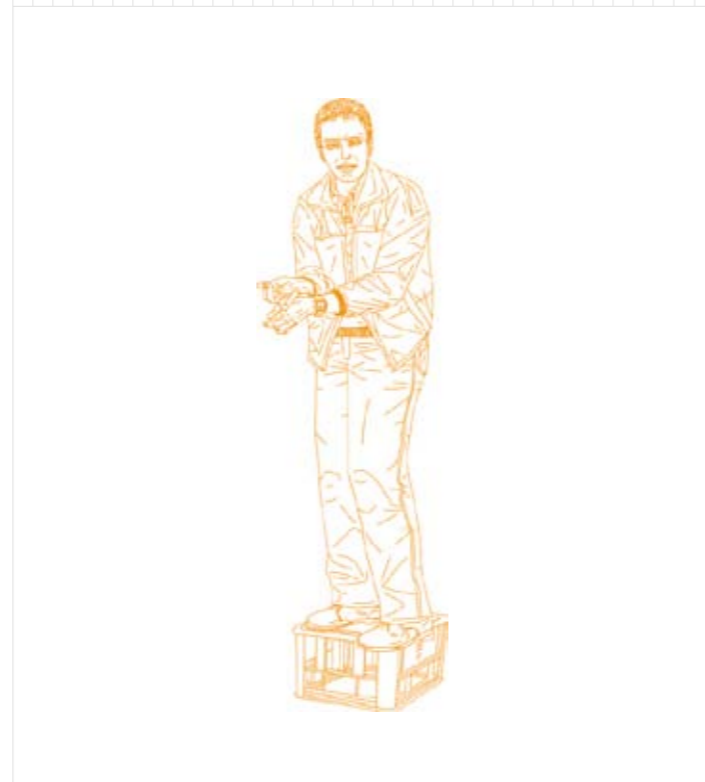
Alex Hanimann, Mann auf Kiste , 2009, dessin vectoriel sur papier, 29,7 x 21 cm