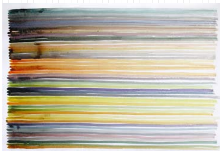
Mireille Mercanton-Wagnières, Lettre à mon jardin 26.10.08

Mireille Mercanton-Wagnières Lettre à mon jardin 17.09 - 17.10