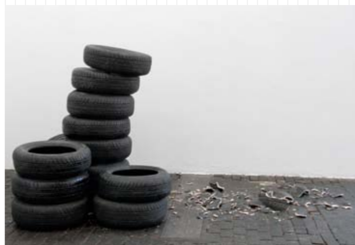
Maude Schneider, Vestige, 2008, céramique

Klat Utopie et quotidienneté Entre art et pédagogies 27.12.09 - 14.02.10