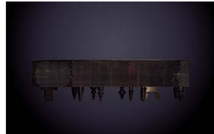
Crystallized Cabinet by Jaime Hayon