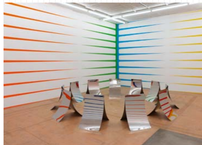
Vue de l'exposition Turnaround de Stéphane Dafflon

Expositions monographiques de Thomas Bayrl Denis Castellas Nina Childress Stéphane Dafflon Deimantas Narkevicius Maria Nordman