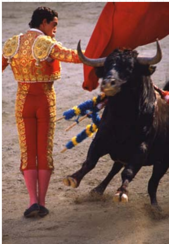
Lucien Clergue. Tauro CXXIII , Arles 1989. Photographie