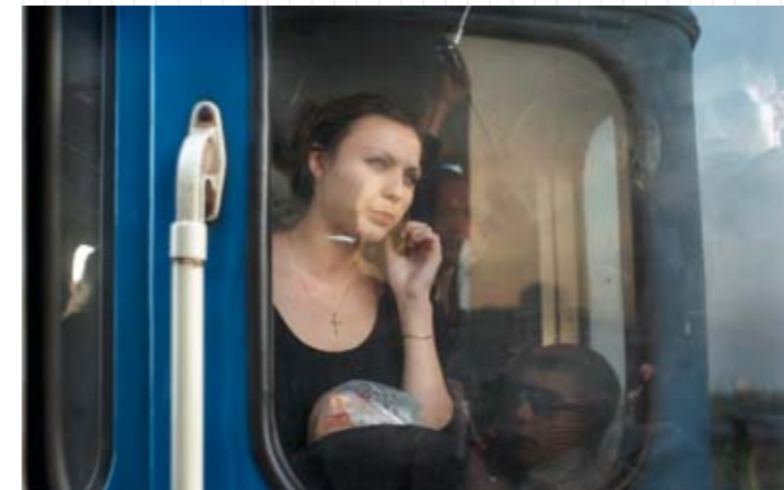
Women on metro, Kyiv, 2008. Exposition Cadrer l'Est