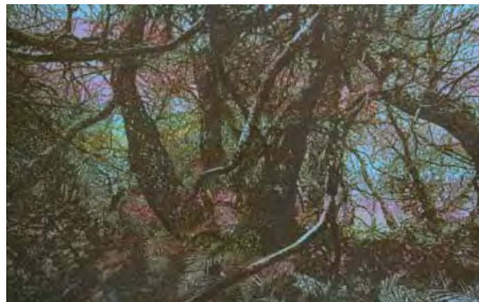
Michel Huelin, Primary Forest II , 2011, peinture alkyde sur dibond, 125 × 200 cm

63, rue des Maraîchers | 1205 Genève T +41 22 328 38 02 | F +41 22 328 40 03 galerie@blancpain-artcontemporain.ch | www.blancpain-artcontemporain.ch Ma – ve 14.30–18.30 | sa 14.00–17.00 et sur rendez-vous