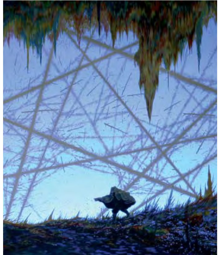
Tempête silencieuse , détail, 2010, huile et acrylique sur toile et néons lumière noire