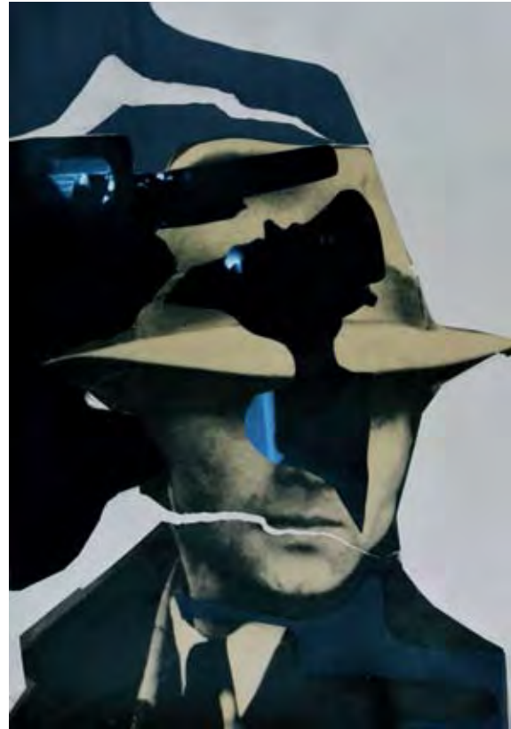
Anna Parkina, Untitled , 2011, collage, 43 x 30 cm