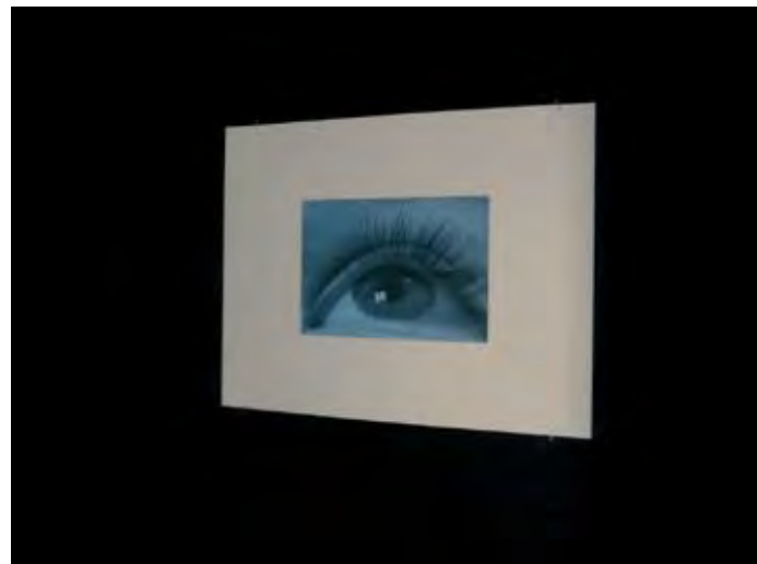
Vanessa van Obberghen, off shore world , 2011, collage, photographie noir et blanc, crayon couleur, feuille letreset, 44 x 56.7 cm