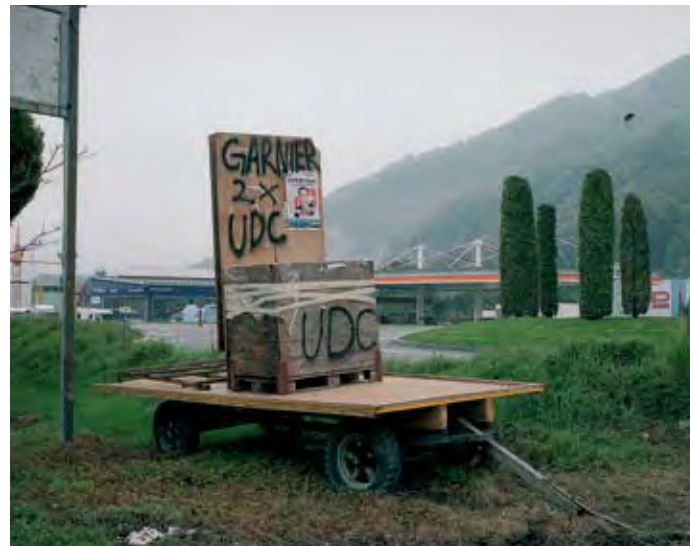
Kampagne, District de Monthey, Floran Garnier, UDC, 2007

Figures Politiques présente la fabrication en images du politicien suisse. La démarche s'inscrit dans un projet plus vaste qui explore les assemblées des partis jusqu'au portrait officiel de la femme et de l'homme d'Etat en Suisse. Le CPG expose les photographies du chapitre «Kampagne» lors des dernières élections fédérales de 2007. Ces affiches des candidat(e)s évoquent le bricolage communicationnel du politique sur fond de paysages typiques et pittoresques. Une projection vidéo met en scène l'intronisation des élu(e)s au moment du photo-shooting officiel organisé au Palais fédéral à Berne tous les quatre ans par les agences de presse.