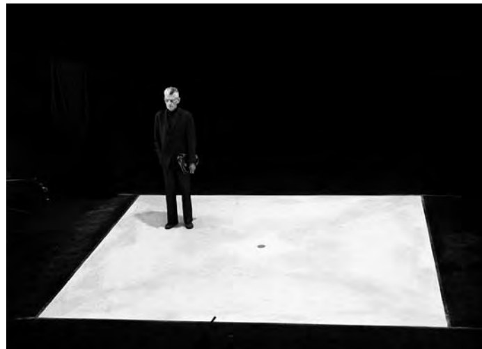
Samuel Beckett on set of Quad

Issues pour la plupart du Fonds André Iten, seront présentées à la Médiathèque les œuvres de Samuel Beckett, réalisées pour la Süddeutscher Rundfunk (SDR) de Stuttgart entre 1977 et 1985 : Geistertrio , ... nur noch Gewölk ... , Quadrat I + II , Nacht und Träume , Was wo . En contrepoint seront projetées les deux œuvres cinématographiques du dramaturge, Film (1964) avec Buster Keaton et Comédie (1966) réalisé avec Marin Karmitz.