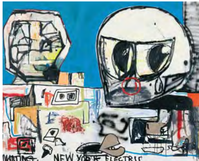
Eddie Martinez, 48 x 60 cm, oil, acrylic and spray on canvas