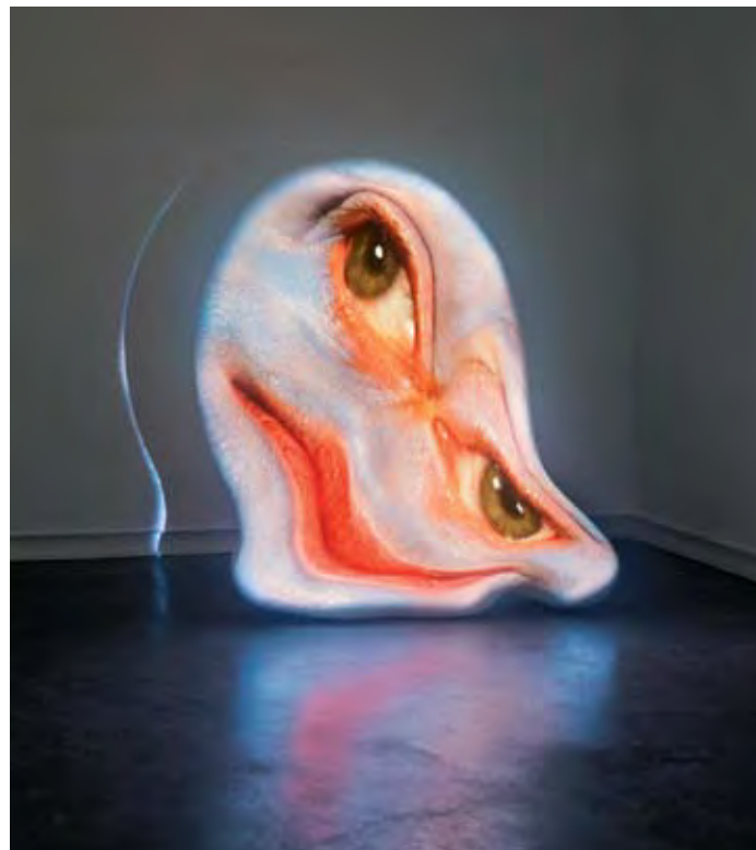
Thaw , 2003, projection vidéo, haut-parleurs, 119,5 × 114,5 cm, Unique © Tony Oursler

En collaboration avec JGM Galerie, Paris