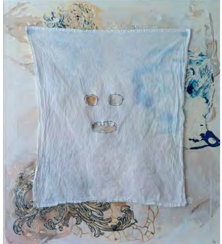
Carter, Untitled , 2011, acrylic ink, acrylic paint, colored pencil, fabric and paper on canvas, 76.2 × 86.4 cm