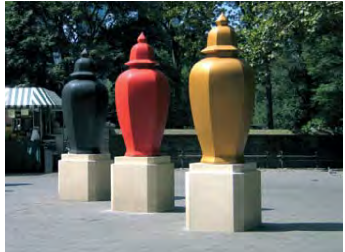
At Doris C. Fredman Plaza, New York

Allan McCollum Perfect Vehicles 15.09–14.10.2011