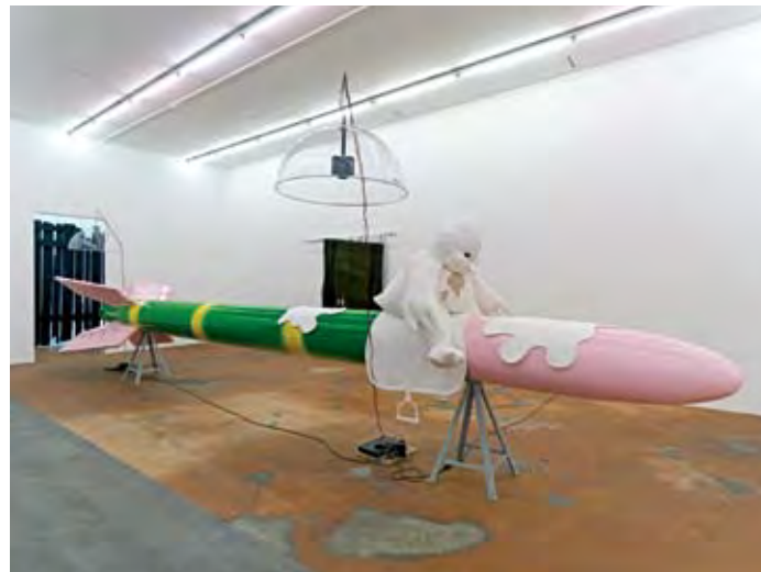
Cosima von Bonin, 2010 Missy Misdemeanour (The Vomiting White Chick, Riley [Loop #5], Mvo's Voodoo Beat & Mvo's Rocket Blast Beat).

Séquence été 2011 Cycle L'Eternel détour Jusqu'au 18.09.2011