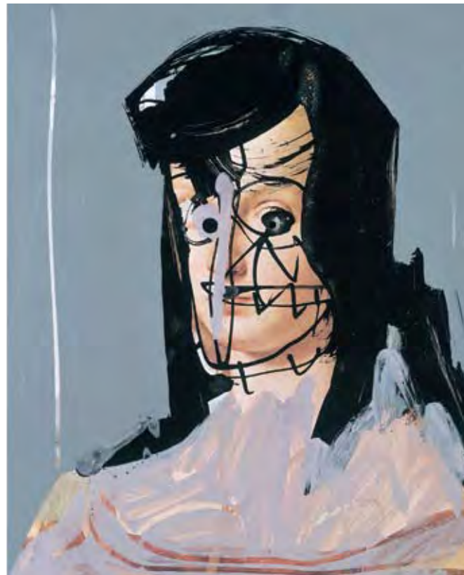
Antonio Saura, Dame , 1974, gouache et encre de Chine sur papier imprimé