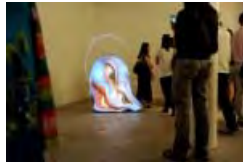
Les vernissages de la Nuit des Bains