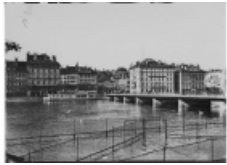
Genève au fil du temps