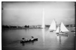
Le Jet d'eau fête ses 120 ans