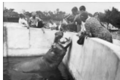
Genève au fil du temps