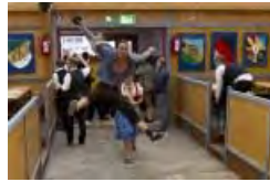
La Fête de la bière de Munich est lancée