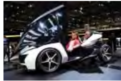
Le Salon de Francfort façonne la voiture du futur