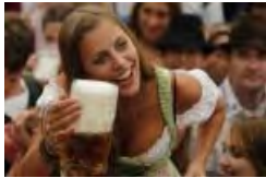
La Fête de la bière de Munich est lancée