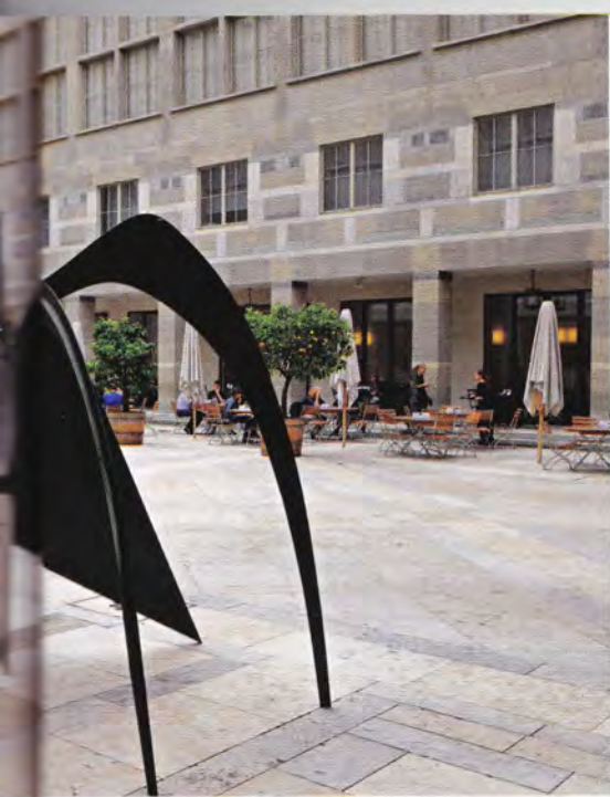
Bertrand Rieger / Hémis