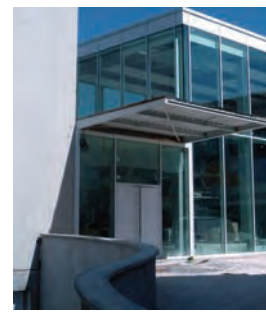
Exposition d'ouverture Le Consortium, Dijon (F) Du 9 juin au 30 octobre 2011

«Peau Neuve» fait référence à l'expression "faire peau neuve"... Cette exposition est un "gommage esthétique" de la galerie : changer pour un nouveau lieu et présenter de nouveaux noms. Le projet mettra l'accent sur les différents aspects de la perception d'un "espace galerie", sur la configuration de l'exposition, dans laquelle les œuvres (peinture, dessin, sculpture, photographie) influenceront l'environnement émotionnel du visiteur. Artistes participants : A. Bauer, F. Boisrond, Carlos No, C. Doutrigne, I. Kageyama, H. Katz, P. Klasen, Nico, G. Ortega, N. Pouyandeh, C. Rudd, J.-M. Scanreigh. – Photo : Jean-Marc Scanreigh, «delmet près don» (détail), huile sur toile, 130x81 cm, 2010.