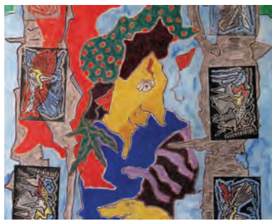
Peau Neuve Galerie Elizabeth Couturier, Lyon (F) Du 27 mai au 30 juin 2011

La Fondation Boghossian présente l'exposition « Pudeurs et Colères de Femmes », à la Villa Empain, avec entre autres, des œuvres d'Orlan, Charlie Le Mindu, Louise Bourgeois, ... Rituels, perruques, foulards, maquillages et tant d'autres contraintes ont caractérisé la vie des femmes depuis des siècles, entre dissimulation, dévoilement et révélation. Depuis des millénaires et dans la plupart des cultures, les femmes cachent certaines parties de leur corps... S'agit-il d'une pudeur naturelle qui les protège, de signes de respect, de contraintes imposées par une décence reconstruite collectivement ? – Photo : Maimouna Guerresi, Black Oracle, photo, 2009, courtesy Photo&Contemporary Gallery (Turin).