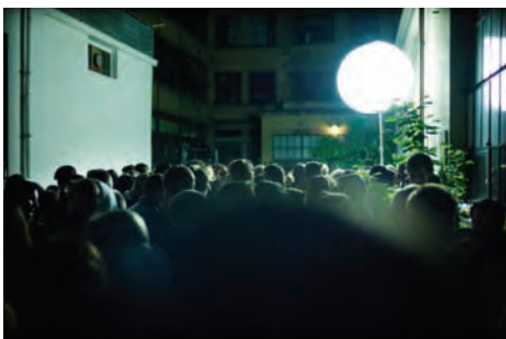
Nuit des Bains Quartier des Bains, Genève (CH) Le 19 mai 2011

À l'occasion de l'ouverture du pôle d'art contemporain 37 rue de Longvic à Dijon, de nombreux artistes de renommée nationale et internationale seront exposés et présentés au public, avec, entre autres : Dan Graham, Yayoi Kusama, Bertrand Lavier, Don Brown, Olivier Mosset, Richard Prince, Cindy Sherman, etc. Le nouveau bâtiment du Consortium, conçu par Shigeru Ban, ouvrira ses portes au début du mois de juin 2011 sur l'ancien site de l'Usine, au 37 de la rue de Longvic à Dijon. Le Consortium présente à cette occasion des œuvres, projet inédits, interventions spéciales, monographies... – Photo : Vue du nouveau bâtiment, conception : Shigeru Ban, ©Le Consortium.