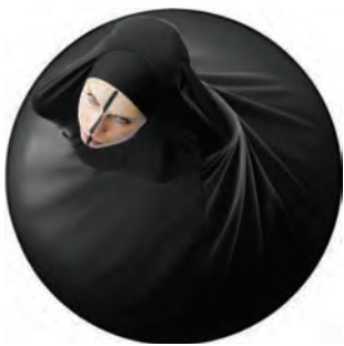
Pudeurs et colères de femmes Villa Empain, Bruxelles, Belgique (B) Jusqu'au 25 septembre 2011

Quelques événements à voir en Belgique, en France, en Suisse.