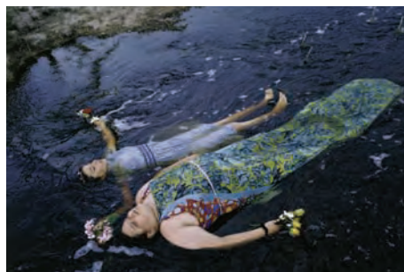
Alessandra Sanguinetti Flux Laboratory, Genève (CH) Jusqu'au 12 juin 2011

Au programme de la prochaine Nuit des Bains, des artistes confirmés comme Marc Quinn chez Patricia Low Contemporary, l'artiste indienne Sharmila Samant chez Pierre Huber, une exposition collective de photographies au 5 rue de la Muse, avec notamment Mike Kelley, Rhona Bitner ou Gilbert & George, et des artistes suisses importants ou émergents comme Andreas Dobler, chez Evergreene, Benjamin Valenza chez Ribordy Contemporary, Josse Bailly chez SAKS ou Alexandre Bianchini chez Skopia. Mais la grande nouvelle, c'est l'ouverture prochaine de la galerie parisienne Xippas Art Contemporain de Renos Xippas à la Rue des Sablons.